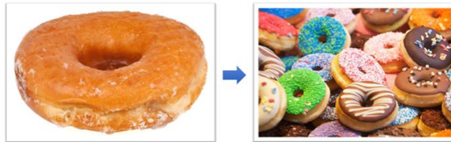
Minimálisan működőképes termék